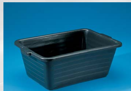
NESTBARE BAK 65 LTR.

Artikelnr.: 5061=zwart/black 5062=grijs/grey Maten/sizes: l x b x h 75 x 46 x 32 cm