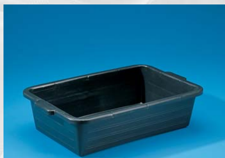
NESTBARE BAK 40 LTR.

Artikelnr.: 5041=zwart/black 5042=grijs/grey Maten/sizes: l x b x h 65 x 45 x 27 cm