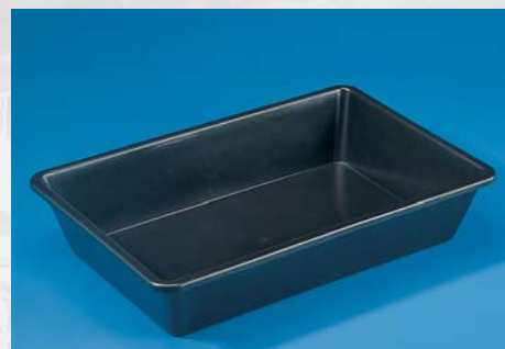
NESTBARE BAK 20 LTR.

Artikelnr.: 5021=zwart/black 5022=grijs/grey Maten/sizes: l x b x h 65 x 40 x 18 cm