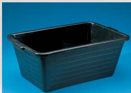
NESTBARE BAK 90 LTR.

Artikelnr.: 5061=zwart/black 5062=grijs/grey Maten/sizes: l x b x h 75 x 46 x 32 cm