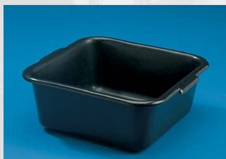
BAKJE 9 LTR.

Artikelnr.: 5011=zwart/black Maten/sizes: l x b x h 60 x 40 x 12 cm