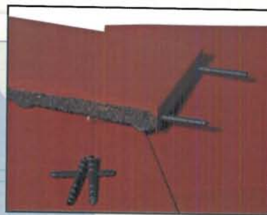
detail 45mm. tegel