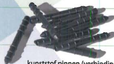
kunststof pinnen (verbinding 45mm. tegel)